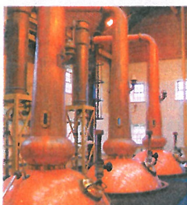
Uit bijproduct van whisky is biobrandstof te winnen

WHISKY Bijproducten uit de whiskydestillatie kunnen als biobrandstof worden ingezet. Het Schotse bedrijf Celtic Renewables